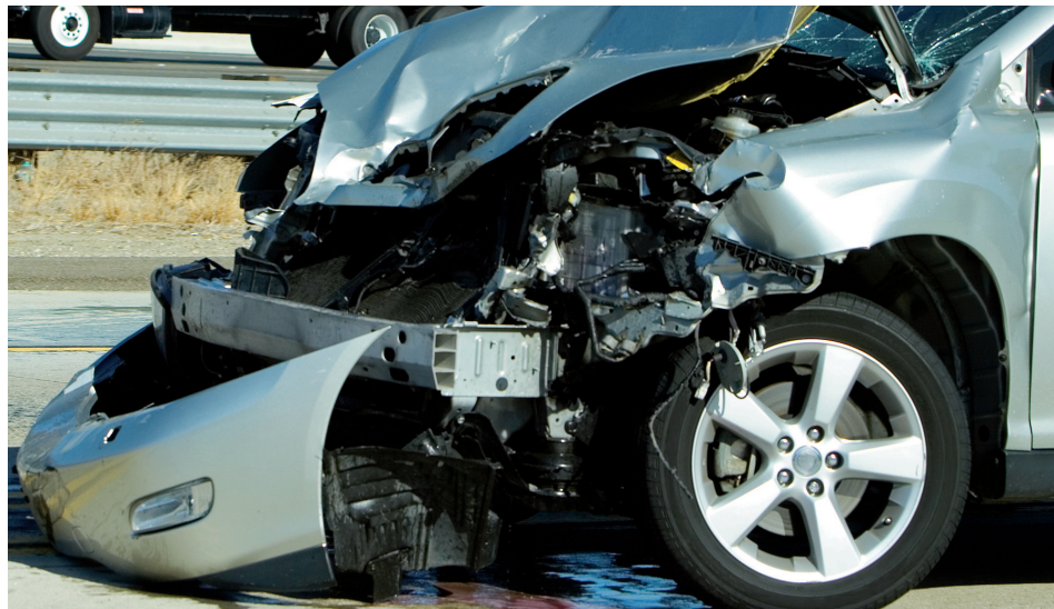
Das Unfallrisiko der 18- bis 24-jährigen Fahrzeuglenkenden ist besonders hoch.

Strassenverkehr Im Strassenverkehr kommen in der Schweiz jährlich rund 400 Menschen ums Leben. Häufigste Unfallursachen sind übermässiger Alkoholkonsum und übergesetzte Geschwindigkeit. Beide Ursachen findet man besonders häufig bei Fahrzeuglenkern unter 25 Jahren.