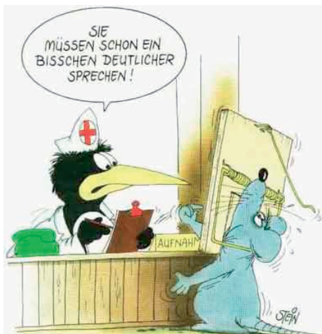
Die Unfallversicherung bezahlt jeden Arztbesuch ohne Franchise und Selbstbehalt.

Die Unfallversicherung leistet zudem auch Transport-, Rettungs- oder Bestattungskosten sowie Renten an Hinterbliebene, die bis zu 70 Prozent des versicherten Lohnes betragen können.