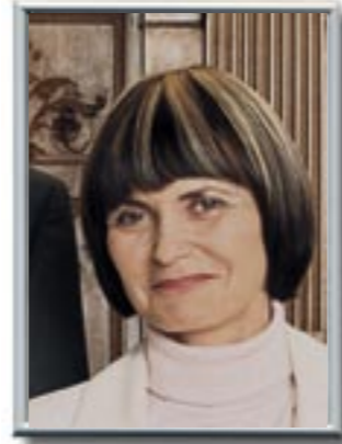
Bundesrätin Micheline Calmy-Rey Vorsteherin des EDA

Es wurde gerungen, geschenkt hat man sich nichts: Verhandlungen sind eine harte Sache, auch wenn die Partner Nachbarn sind und sich so gut kennen wie die Schweiz und die EU.