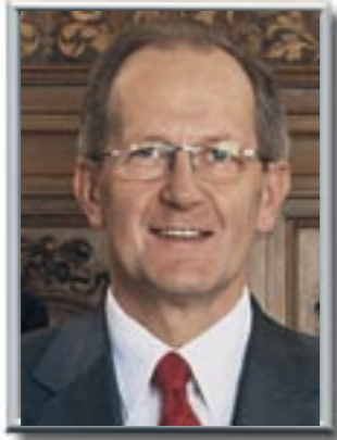
Bundespräsident Joseph Deiss Vorsteher des EVD