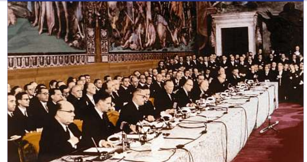
Unterzeichnung der Römer Verträge am 25. März 1957 im Konversatoren-Palast auf dem Kapitol in Rom. An diesem Tag setzten die Ministerpräsidenten und Aussenminister von sechs europäischen Ländern ihre Unterschriften unter die Vertragswerke über die Europäische Wirtschaftsgemeinschaft (EWG) und die Euratom.

Präambel des EWG-Vertrages von Rom 1957 in der heute gültigen Formulierung.