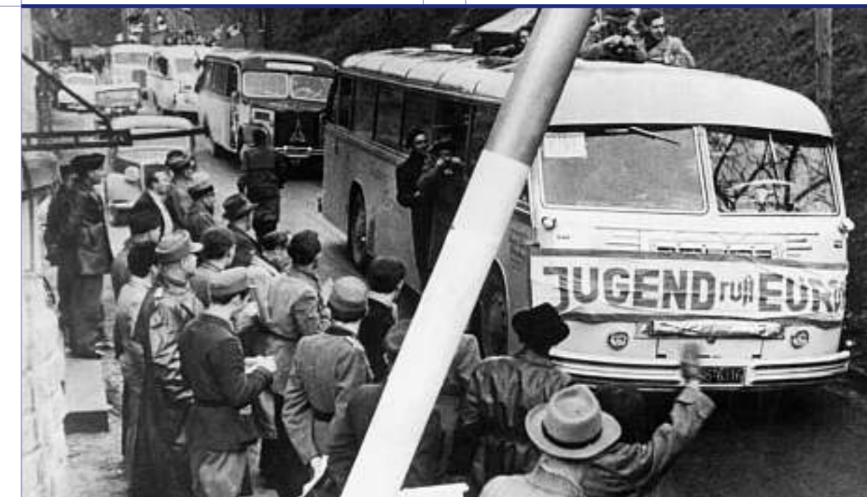
«Jugend ruft Europa» – Busse mit Teilnehmerinnen und Teilnehmern einer Europa-Kundgebung fahren an der französisch-deutschen Grenze Anfang der 1950er Jahre vorbei.