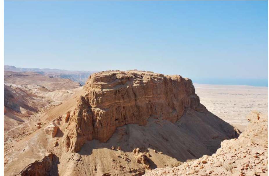
Masada – ein Tafelberg in der Wüste. Im Hintergrund das Tote Meer.

5. „Der Messias ist da!“ Gestaltet das Drehbuch oder das Storyboard für einen Kurzfilm, der die Ankunft des Messias zum Inhalt hat! Ist jetzt alles gut?