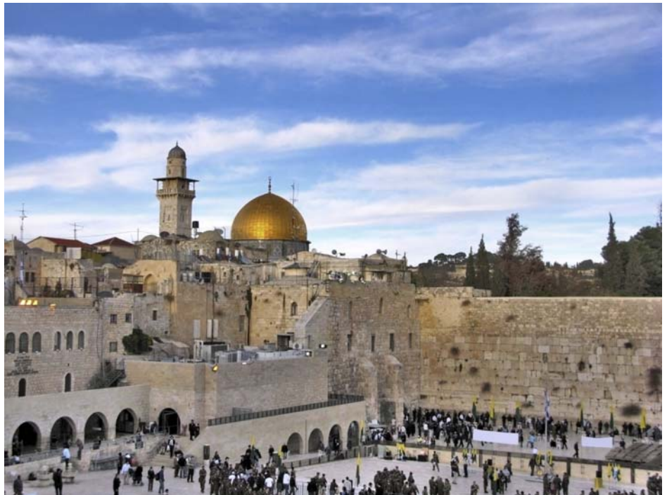
Ein Teil der Westmauer. Im Hintergrund die Kuppel des Felsendoms. Der Turm links davon gehört zu einem anderen Gebäude außerhalb des Tempelbergs.

Die Westmauer (im Judentum wird die Bezeichnung „Klagemauer“ nicht verwendet) ist für Juden von besonderer Bedeutung. 1967 gelang es der israelischen Armee im sogenannten „Sechs-Tage-Krieg“, Ost-Jerusalem und damit den Zugang zum Tempelberg zu erobern. Dennoch hat der Staat Israel darauf verzichtet, den Tempelberg in Besitz zu nehmen. Der damalige Armeechef vermied diese Provokation bewusst und überließ den Bezirk einer islamischen Stiftung zur Verwaltung.