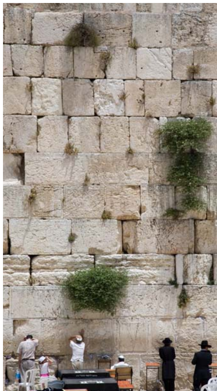
Betende an der Westmauer. In den Ritzen wachsen Kapernbüsche.

Der Tempelberg ist mit zwei muslimischen Heiligtümern bebaut: dem Felsendom , einem Sakralgebäude mit achteckigem Grundriss und vergoldeter Kuppel, die weit über Jerusalem aufleuchtet, und der Al-Aqsa-Moschee , die äußerlich sehr viel unscheinbarer ist. Hier halten Muslime wöchentlich ihr Freitagsgebet. Beide Gebäude begründen einen islamischen Anspruch auf Jerusalem (vgl. Arbeitsblatt 6).