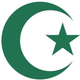
Der islamische Halbmond © H. C. Kley

Der Halbmond mit oder ohne Stern ist heute das Symbol des Islam. Er erinnert an den Kalender der Muslime, der dem Mond folgt.