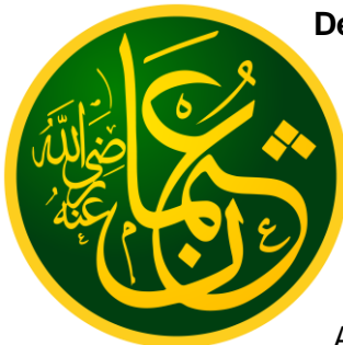
Kalligrafie: Kalif Uthmān

Der zweite Kalif hieß Umar (634-644). Er begann den Staat militärisch auszudehnen und wurde von persischen Gegnern ermordet.