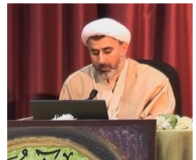
Schiitischer Geistlicher

Al-Husain, der Sohn Alīs und Enkel des Propheten, wurde bei Kerbelā im Jahr 680 von seinen Gegnern getötet, als er versuchte, die Bildung einer Umayyaden-Dynastie zu verhindern. Dieses Ereignis prägt das Selbstverständnis der Schiiten bis heute. Sie beklagen den Tod Husains in einer Art Passionsspiel und folgen insgesamt etwas anderen Rechtstraditionen als die sunnitische Mehrheit.