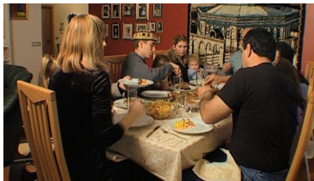
Id al-Fitr im Film