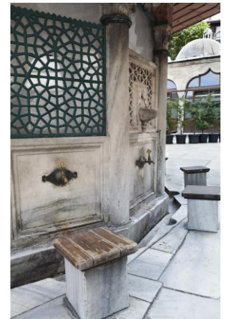
Brunnen vor einer Moschee

Muslime sollen in einem reinen Zustand vor Gott treten. Deswegen sind bestimmte Waschungen vor dem Gebet erforderlich.