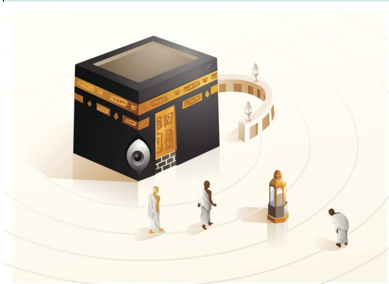
Angedeutete Kreise mit der Kaaba als Zentrum

„Der Ein-Gott-Glaube des Islam stand in unvereinbarem Gegensatz zum altarabischen Polytheismus, in dem Mohammed selbst aufgewachsen war; die Namen von Göttern wie Hubal, Manâf, Wadd, Suwâ', Ya'ûq, oder von Göttinnen wie Allât, Manât und al-'Uzzâ werden uns von frühen arabischen Autoren überliefert und kommen zum Teil auch im Koran vor (53,19; 71,23). Der Stadtgott von Mekka, Hubal, dessen Idol in einem würfelförmigen Gebäude (Ka'ba) verehrt wurde, hieß in vorislamischer Zeit auch einfach Allâh [...]. Die altarabischen Götter und Göttinnen wurden in Form von Statuen, aber auch als einfache Steinsäulen oder Bäume in heiligen Hainen verehrt; ihr Kult war oft mit blutigen Opfern und periodischen Wallfahrten verbunden. [...]