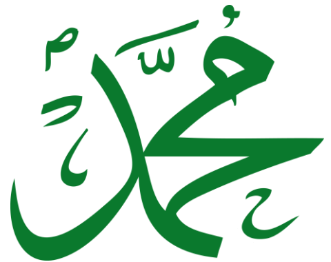
Kalligraphie: Mohammed © H. C. Kley

Wie bei vielen Religionsstiftern ist auch bei Mohammed eine historisch zuverlässige Biografie nur schwer fassbar. Ibn Ishâq (704-767 n. Chr.) verfasste eine erste Lebensgeschichte ( sîra ). Auf dieses Werk beziehen sich die meisten Darstellungen des Lebens Mohammeds bis heute. Wie bei Christus und Buddha haben sich auch beim Leben Mohammeds historische Fakten mit frommen Legenden vermischt. Es ist daher nicht mehr möglich, das eine vom anderen zuverlässig zu trennen. Der Koran selbst gibt kaum eindeutige Hinweise auf historische Einzelheiten. Einige Koranverse werden erst durch die Lebensgeschichte Ibn Ishâqs als biografische Notizen gedeutet.