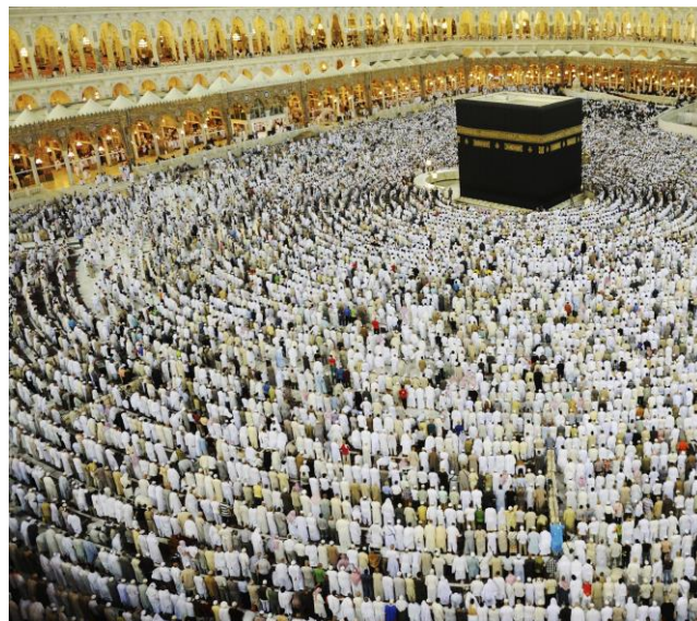
Mekka am ersten Tag der Pilgerfahrt