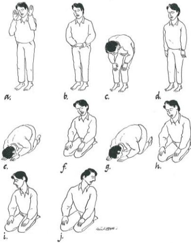
Die Gebetshaltungen

Die Betende eine feststehende Abfolge von Körperhaltungen ein und spricht feste Textstücke (Anrufungen, Teile aus dem Koran, Gebete). Gebetet wird immer an einem reinen Ort oder auf einem extra ausgebreiteten Teppich. Die Gebetsrichtung ist stets nach Mekka ausgerichtet. In der Moschee wird die Gebetsrichtung durch eine Nische in der Wand, den Mihrab, angezeigt.