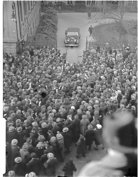
Berlin, Ernennung Adolf Hitlers zum Reichskanzler

Als am Abend des 30. Januar 1933 Anhänger der Nationalsozialisten den lang ersehnten "Tag der Machtübernahme" mit Fackelzügen durch das Brandenburger Tor feierten, markierten die triumphierenden Kundgebungen auch symbolisch das Ende der Weimarer Republik. Wenige Stunden zuvor hatte Reichspräsident Paul von Hindenburg den Vorsitzenden der Nationalsozialistischen Deutschen Arbeiterpartei (NSDAP), Adolf Hitler, zum neuen Reichskanzler ernannt. Hitlers Absicht, eine von jeder Kontrolle durch den Reichstag befreite, autoritäre Regierung zu etablieren, die das von vielen Deutschen empfundene "demokratische Chaos" der Weimarer Jahre überwinden sollte, verwirklichten die Nationalsozialisten innerhalb kürzester Zeit. Unter Wahrung des Anscheins verfassungsmäßiger Legitimität verstanden sie es, politische Gegner auszuschalten und sich der staatlichen Machtinstrumente zu bemächtigen.