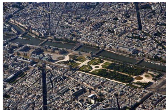
Das Louvre von Oben

Die berühmten Glaspypamiden im Innenhof des Louvres wurden 1985-1989 errichtet und am 29. März 1989 eröffnet. Gleichzeitig mit dem Bau der Pyramide wurde eine unterirdische Halle gebaut, welche heute den Haupteingang des Louvre darstellt. Obwohl die Pyramiden zu Beginn als Gewächshaus und Käseglocke verspottet wurden, sind sie heute teil eines der grössten Museen der Welt und eines der bekanntesten Wahrzeichen von Paris. Die Besucherzahlen des Museums sind seit der Eröffnung der Pyramiden um 5,5 Mio. Besucher jährlich gestiegen.